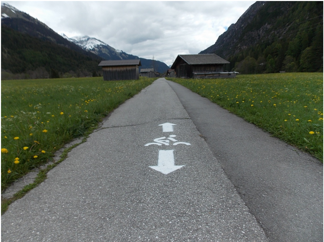
Lech Radweg Start in Steeg